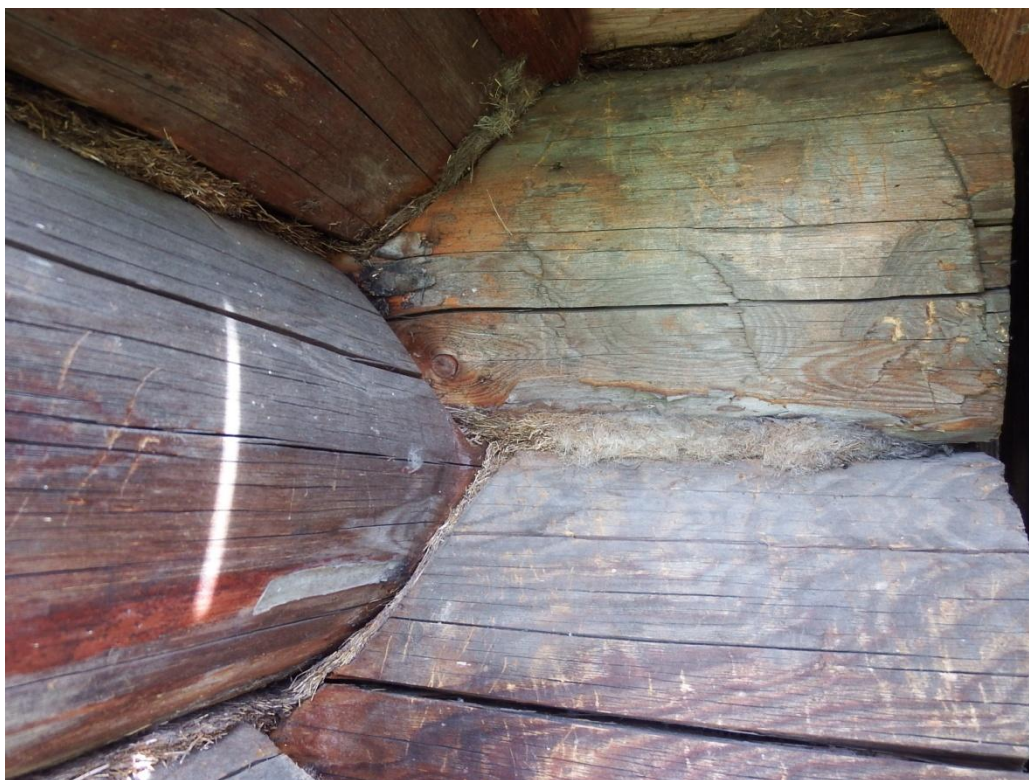
Рис.2.14. Разуплотнение конопатки стыков, трещины в бревнах до половины диаметра.