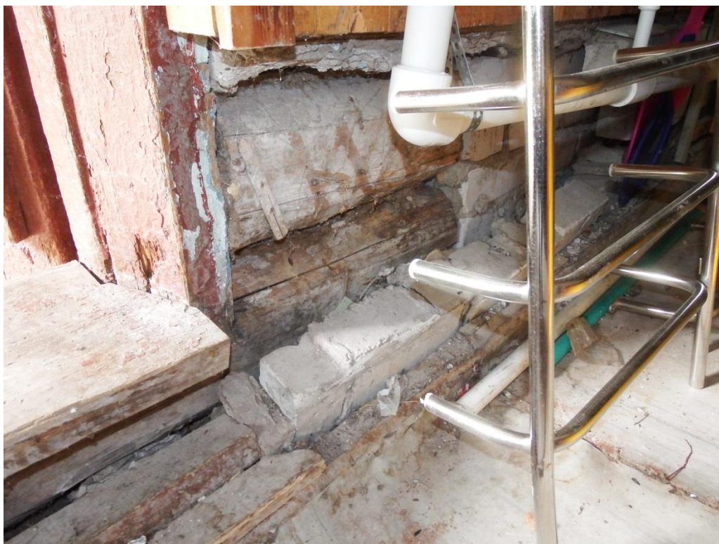
Рис. 2.7. Характерное состояние стен, повреждение отделки, расслоение фундамента, поражение бревен сруба трухлявой гнилью.