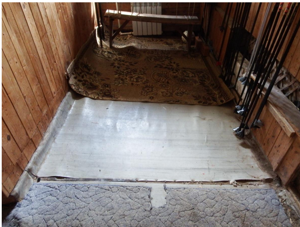
Рис. 2.8. Характерное состояние полов, деформация и провалы.