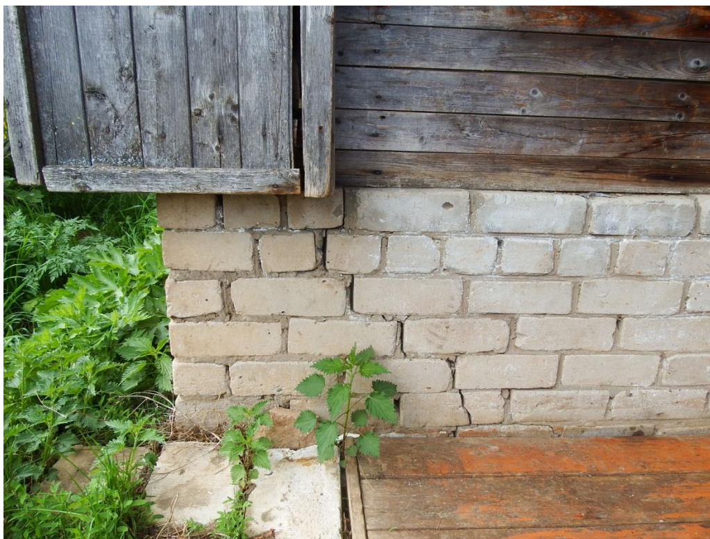
Рис. 2.5. Трещины в фундаменте здания.