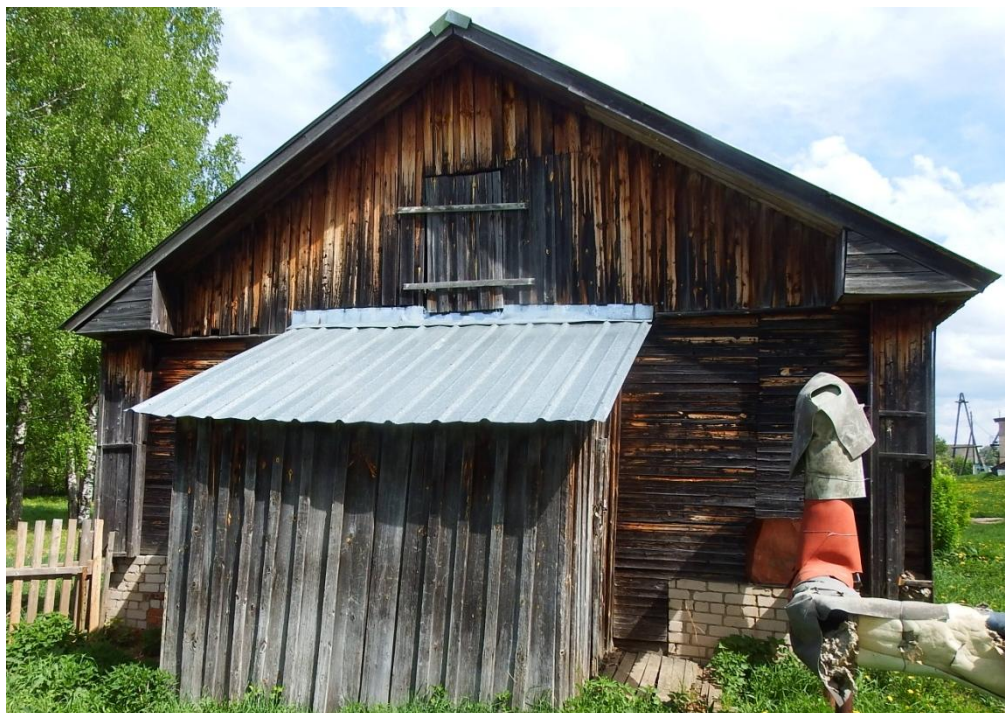
Рис. 2.3. Общий вид здания состояние обшивки.