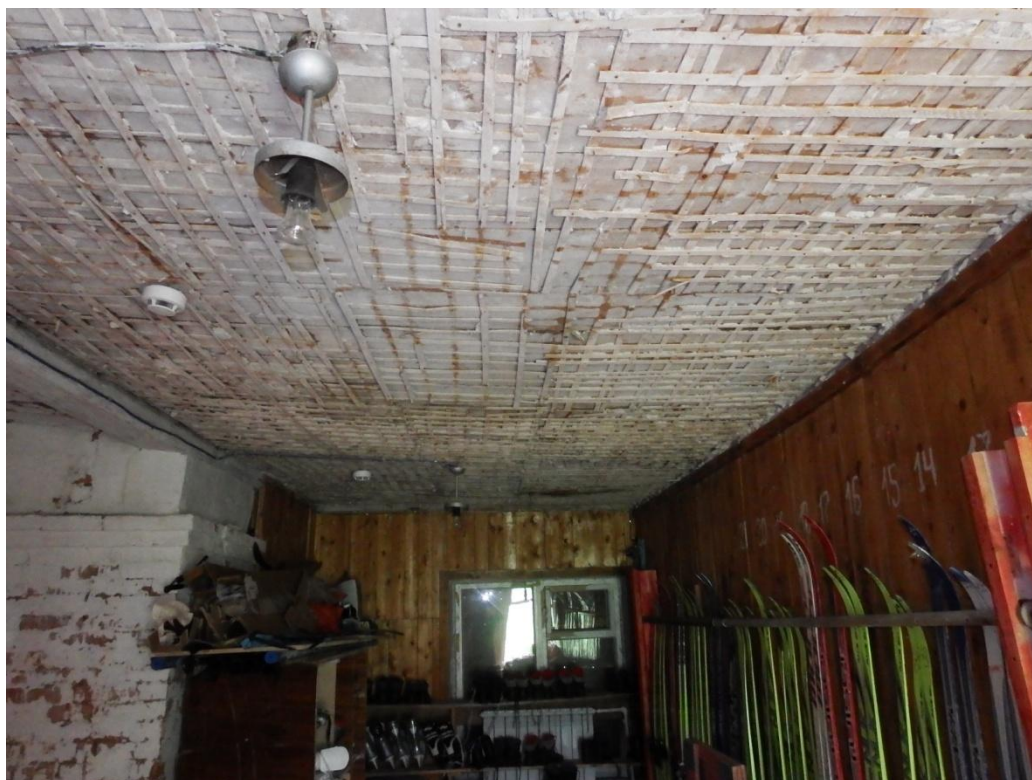
Рис.2.11. Деформация чердачного перекрытия, обрушение штукатурки.