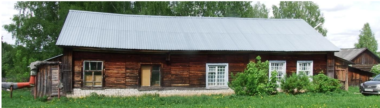
Рис. 2.2. Общий вид здания материального склада – общая деформация.