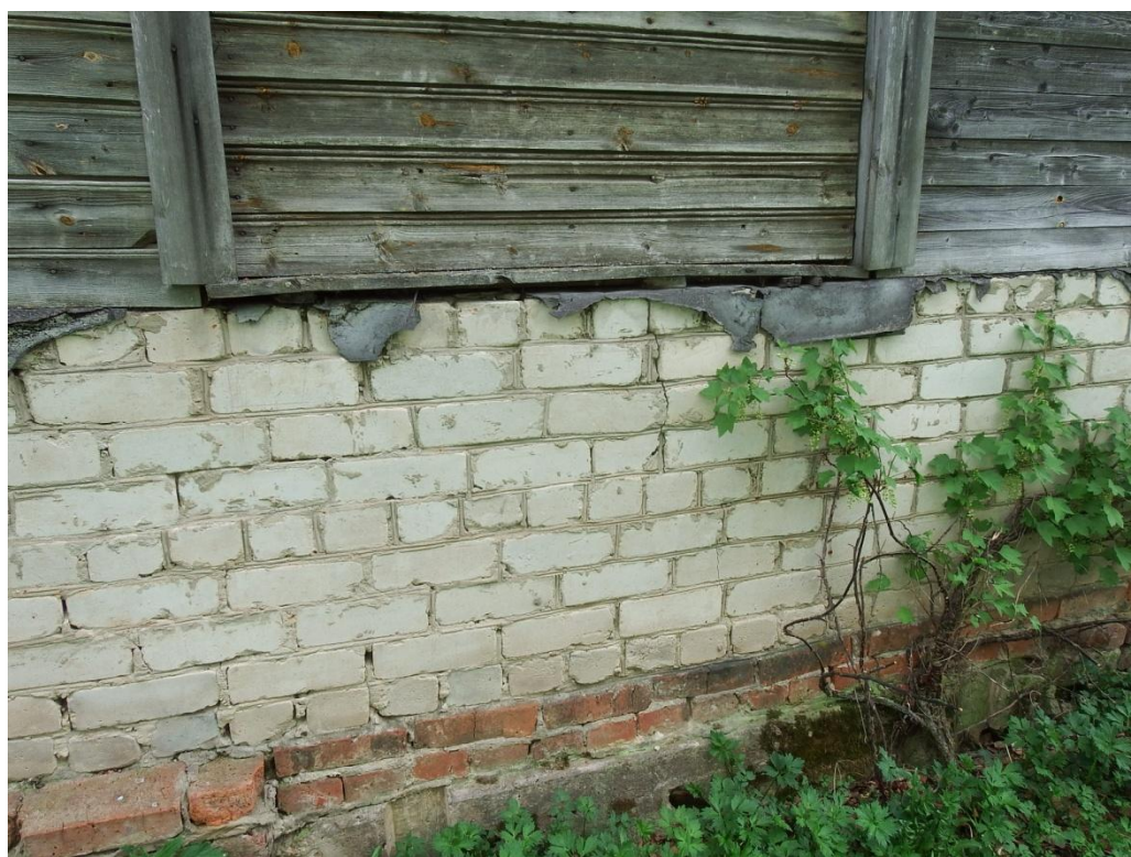
Рис. 2.6. Трещины в фундаменте здания.