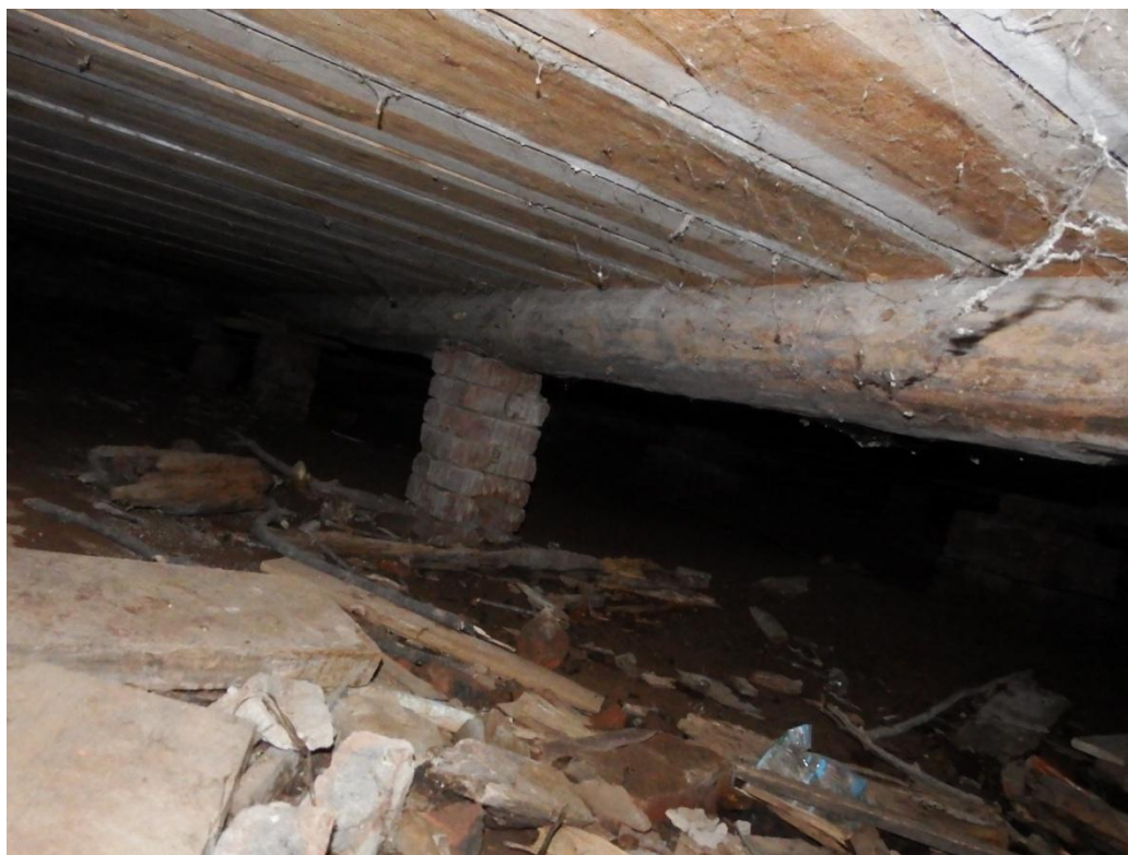
Рис. 2.9. Конструкция и состояние полов по лагам и кирпичным столбикам.