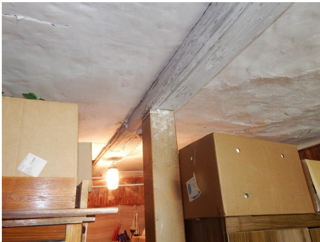
Рис.2.13. Деформация чердачного перекрытия, деревянная подпорка под матичной балкой.