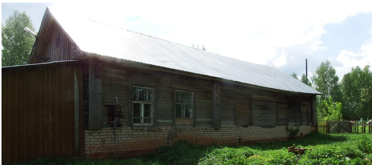
Рис. 2.4. Общий вид здания.