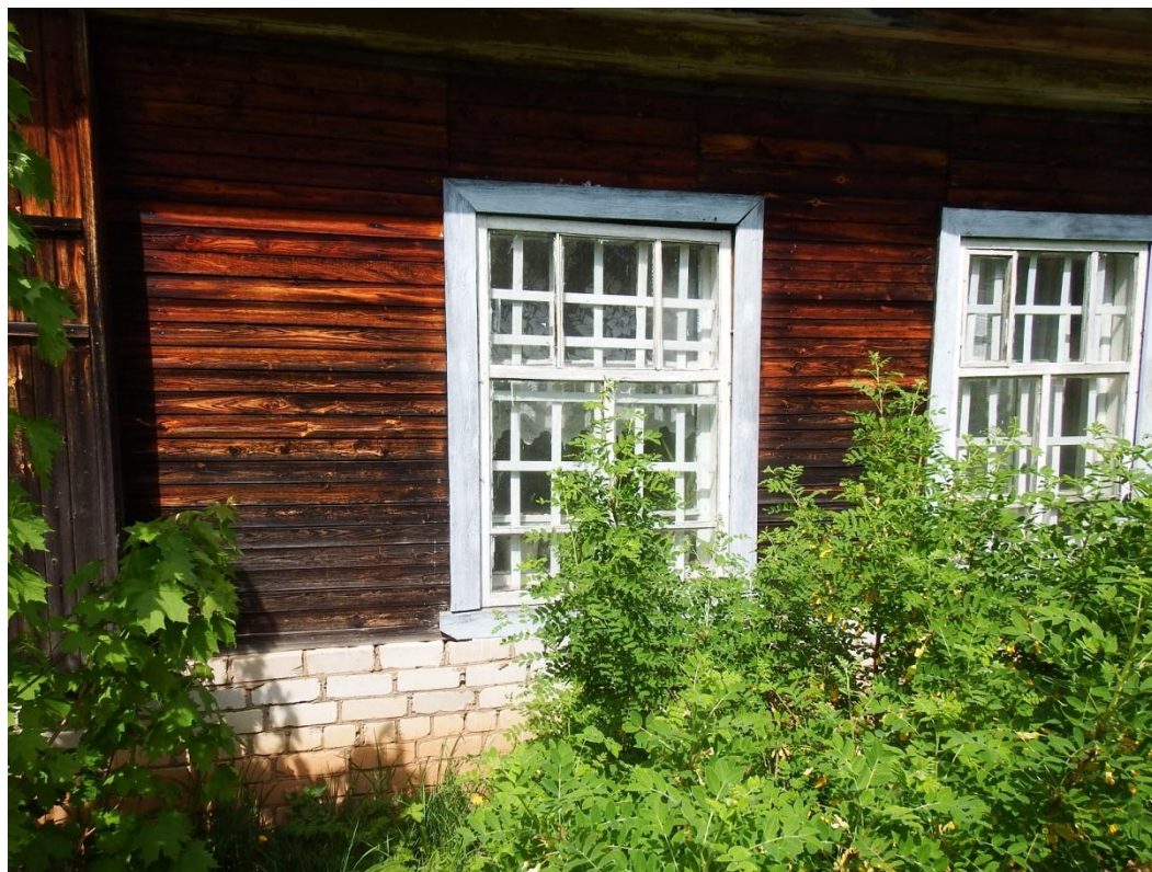
Рис.2.10. Перекос оконных проемов в наружных стенах.